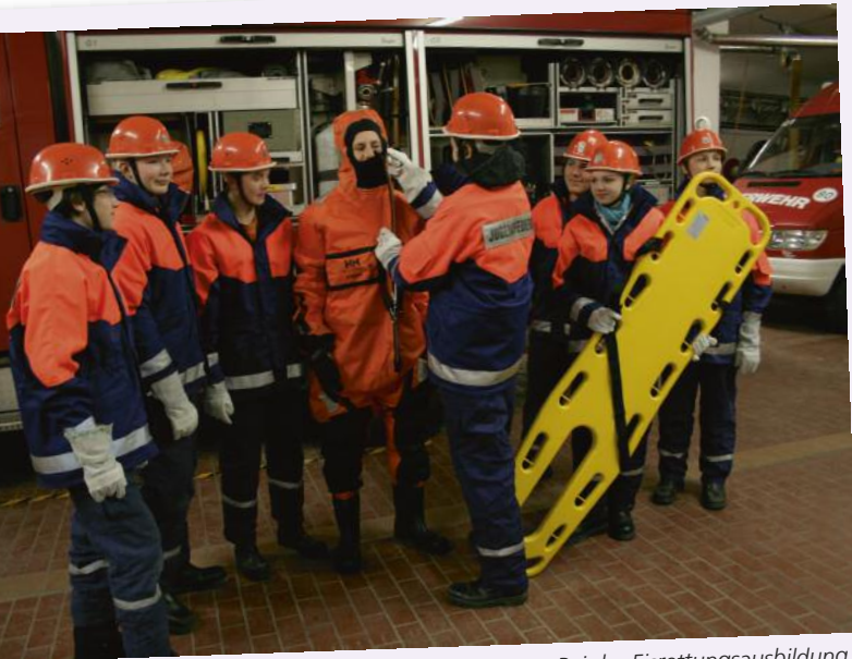
Bei der Eisrettungsausbildung

Fahrzeuge und Ausrüstung: zehn Fahrzeuge mit entsprechender Ausrüstung und Anhängern, ein Arbeitsboot, Eisrettungszubehör, Ölsperren sowie die Unterstützungsgruppe Örtliche Einsatzleitung UG-ÖEL des Landkreises.